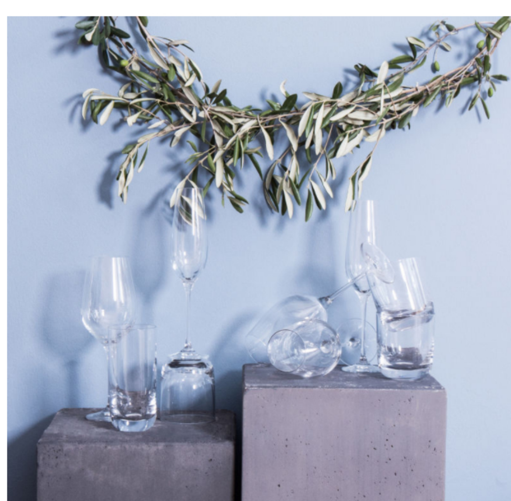
Aus Kristallglas gearbeitete Gläser.