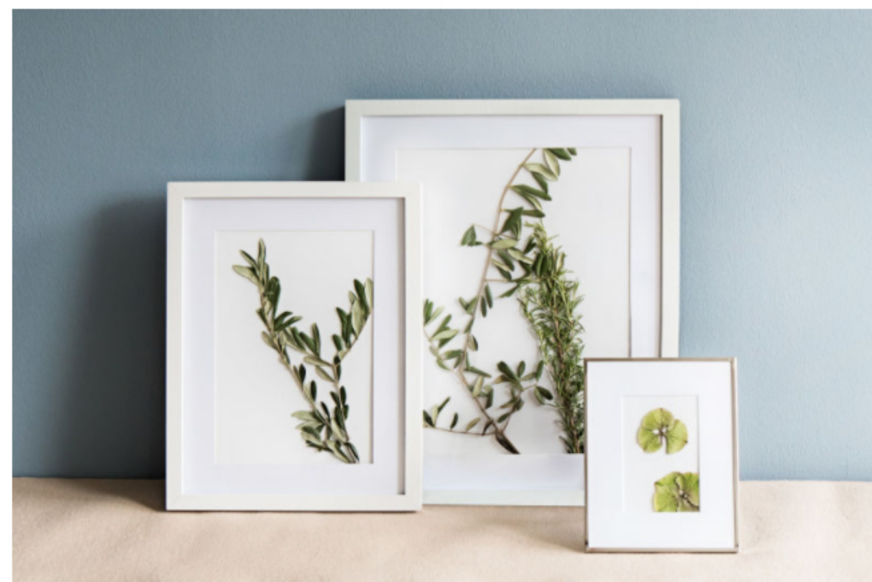
Ebenfalls Teil der ersten Basic-Kollektion: Bilderrahmen.