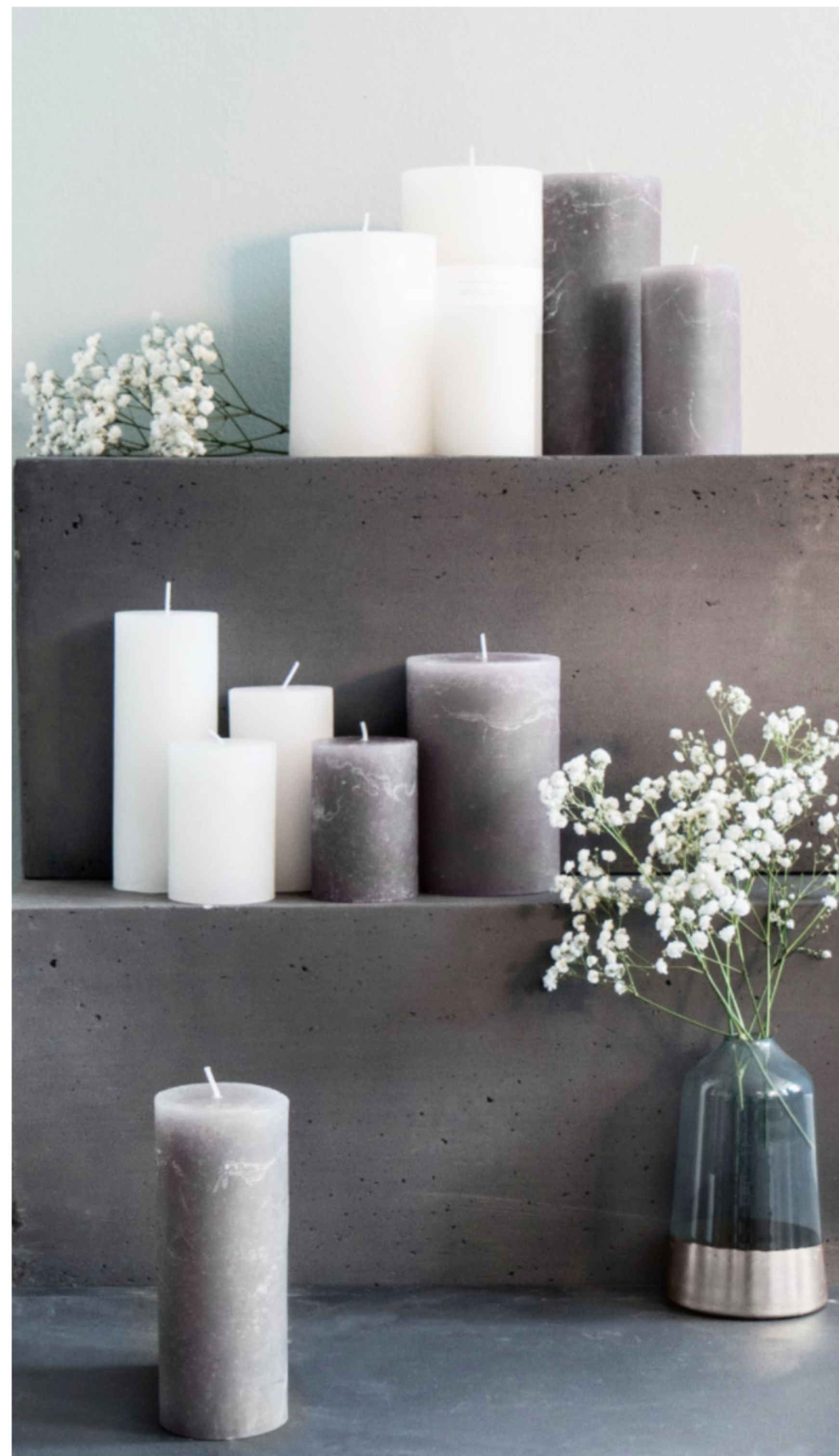
Kerzen aus der ersten Westwing Basic Kollektion.

Westwing launcht eine eigene Basic-Kollektion. Geschirr, Gläser, Besteck und vieles mehr. AD zeigt die Bilder vorab – und verlost gemeinsam mit Westwing fünf mal sechs Champagnergläser!