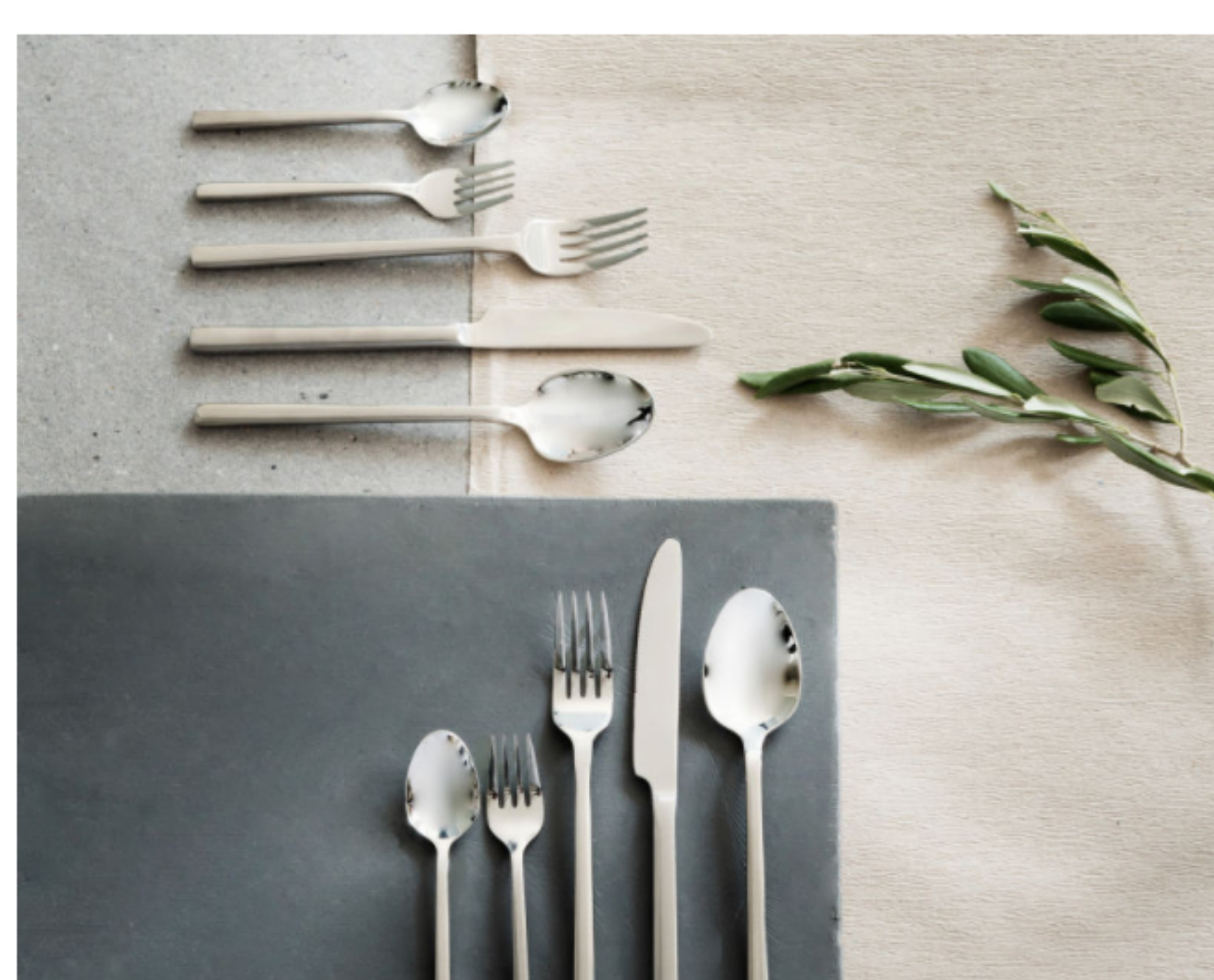
Besteck aus Edelstahl.

Diese beinhaltet neben Tablett, Kerzen, Laternen und Kerzenleuchtern natürlich auch Geschirr, Besteck und Gläser. „Unser Porzellan ist New-Bone-China, und die Gläser haben Kristallin-Anteil“, erzählt Delia Fischer. „Es ist doch immer so: Es gibt Basics – und Basics: schöne weiße T-Shirts und eben weniger schöne. So ist es auch mit Windlichtern, Stoffservietten und Besteck.“