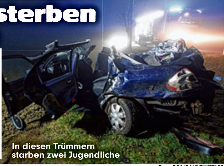
In diesen Trümmern starben zwei Jugendliche

(beide 16), die durch die Wucht des Aufpralles tödlich verletzt wurden. Der Jugendliche starb noch im Wrack, das Mädchen wenig später in der Klinik. Der Fahrer wurde nur leicht verletzt.