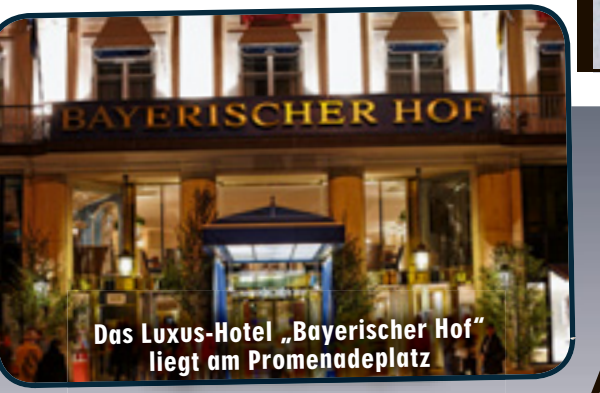
Das Luxus-Hotel „Bayerischer Hof“ liegt am Promenadeplatz