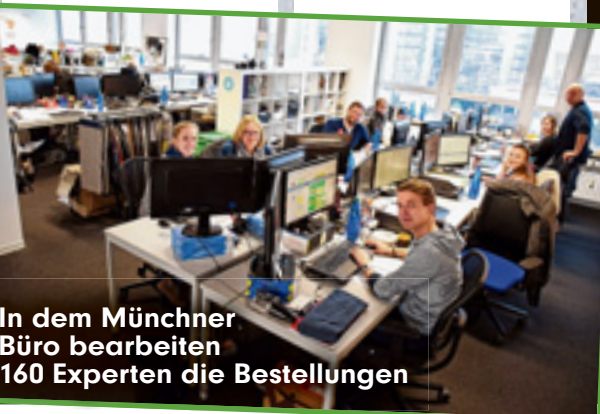
In dem Münchner Büro bearbeiten 160 Experten die Bestellungen