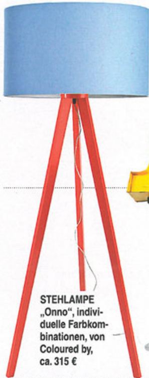
STEHLAMPE „Onno“ , individuelle Farbkombinationen, von Coloured by, ca. 315 €