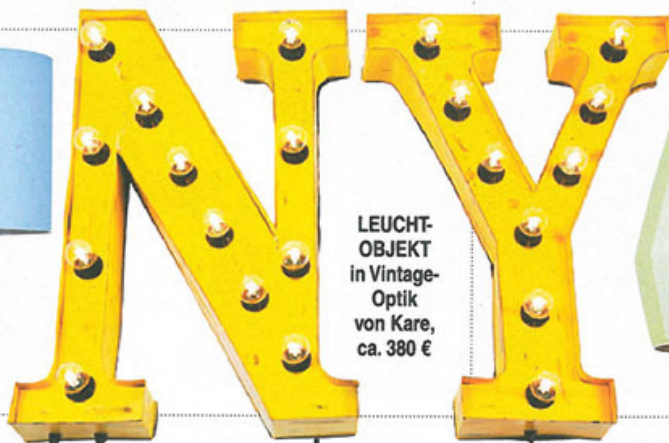
LEUCHT-OBJEKT in Vintage-Optik von Kare, ca. 380 €