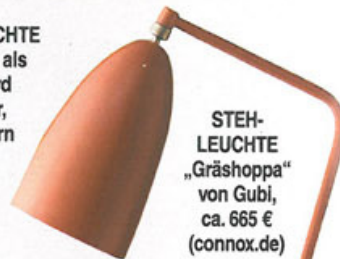
STEHLLEUCHTE „Gräshoppa“ von Gubi, ca. 665 € ( connox.de )