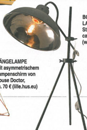
BODENLAMPE von Strömshaga, ca. 90 € ( westwing.de )