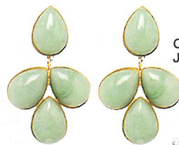
Ohrringe von Justwin, ca. 79 €