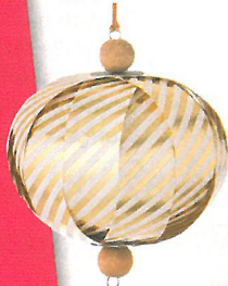
Weihnachtschmuck von Ferm Living, ca. 8 €