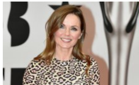
GERI HALLIWELL SO ÜBERWAND SIE DIE BULIMIE