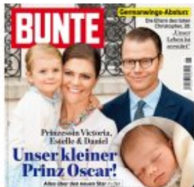
BUNTE DAS HEFT 11/2016