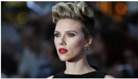
FRISUREN-TREND DIE BOS SIND ZURÜCK!