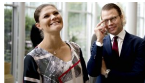
VICTORIA & DANIEL VON SCHWEDEN SIE HABEN DIE TRADITION SCHON WIEDER GEBROCHEN