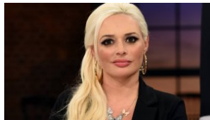
DANIELA KATZENBERGER VORHER/NACHHER: SO SIEHT SIE UNGESCHMINKT WIRK...