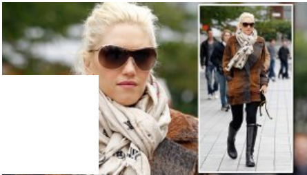
FASHION DIE HERBST-TRENDS 2011!