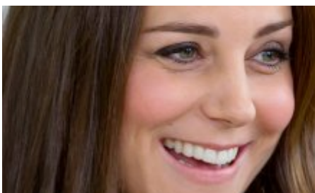
HERZOGIN KATE BEAUTY-GEHEIMNISSE ENTHÜLLT!