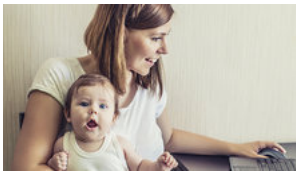
ANZEIGE FAMILIEN SPAREN DANK TRICK HUNDERTE EURO