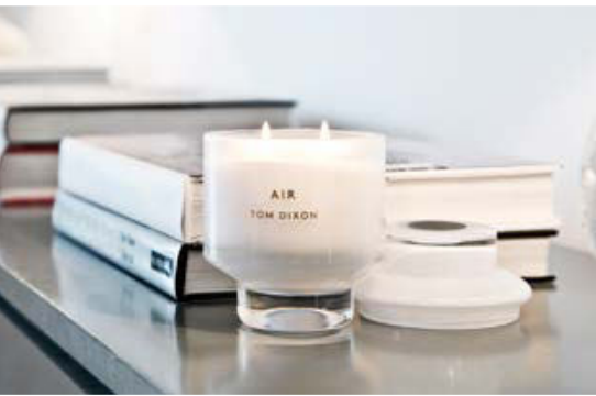
Jedes Accessoires hat seinen Platz

Light flooded rooms can be enhanced by light coloured design elements