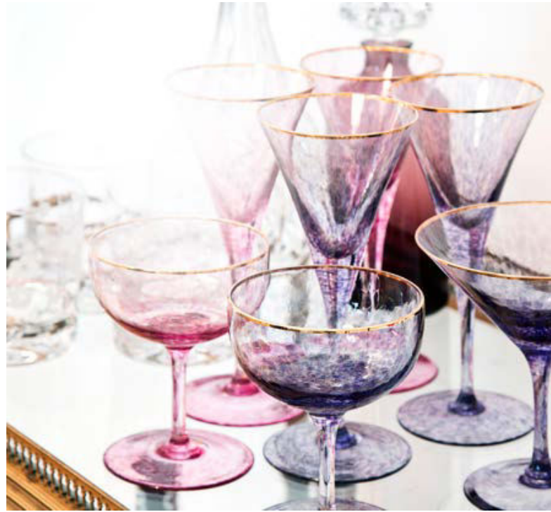
Passende Accessoires finden sich an jeder Stelle

Im Schlafzimmer dominieren ebenfalls Basics in schlichten Tönen, dazu kommen je nach Jahreszeit entsprechende Textilien. Versuchen Sie einmal, im Sommer Accessoires aus Bast zu platzieren und einen Bambusläufer als Bettvorleger einzusetzen. Im Winter ziehen Sie dann Kuschelbettwäsche mit Nor-