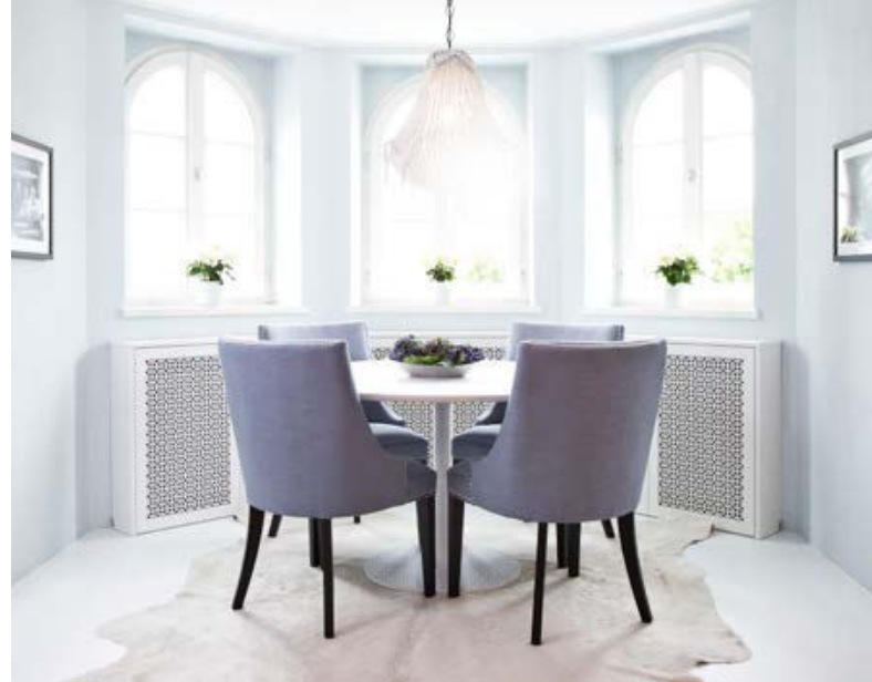
Lichtdurchflutete Räume werden durch helles Design unterstützt

Man sollte es so machen, wie es auch in der Mode Trend ist: Wenn man günstige Kleider mit tollen Accessoires oder Designerstücken mischt, z. B. einer schicken Brille oder ausgefallenen Schuhen, wertet man den gesamten Look auf. Das kann man auch im Wohnbereich anwenden: Ein betagtes Sofa, kombiniert mit einer hochwertigen modernen Couchdecke – das wirkt super. Es sind die Accessoires, die den Unterschied machen!